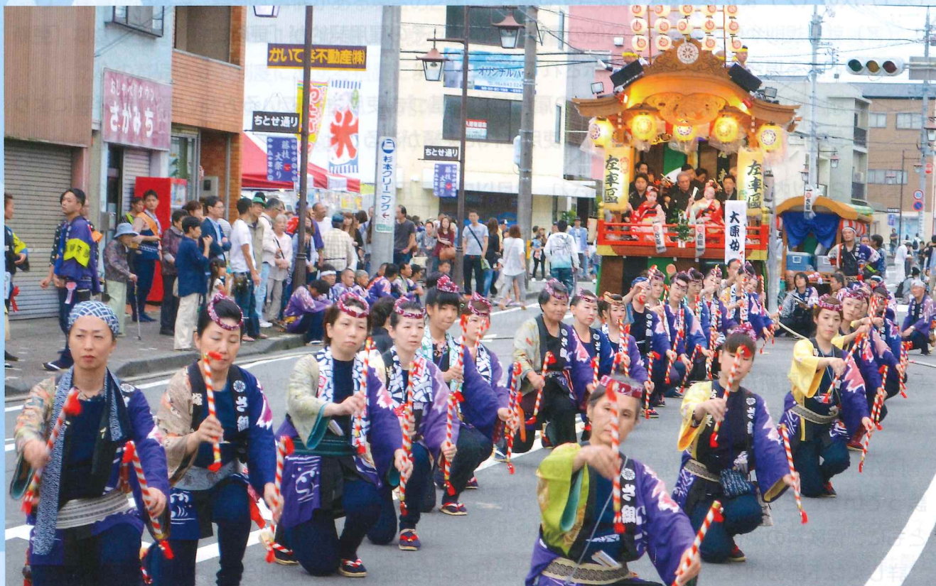
藤枝大祭り