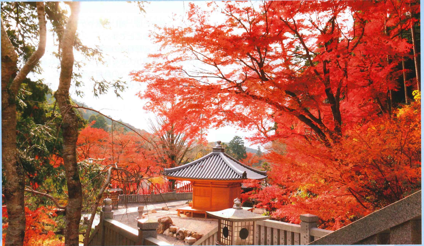
法多山尊永寺 もみじまつり(袋井市)