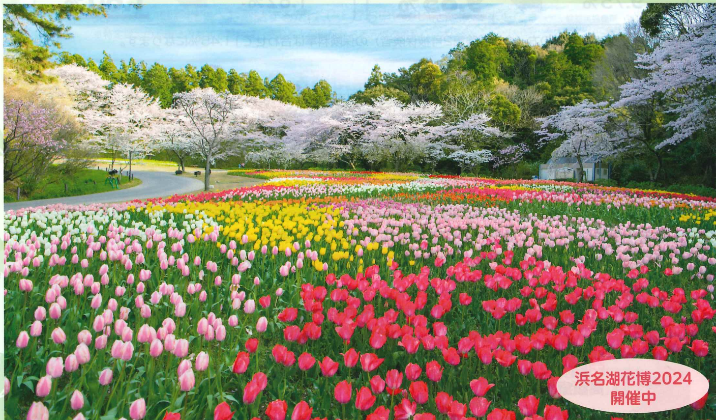
浜名湖花博2024 開催中