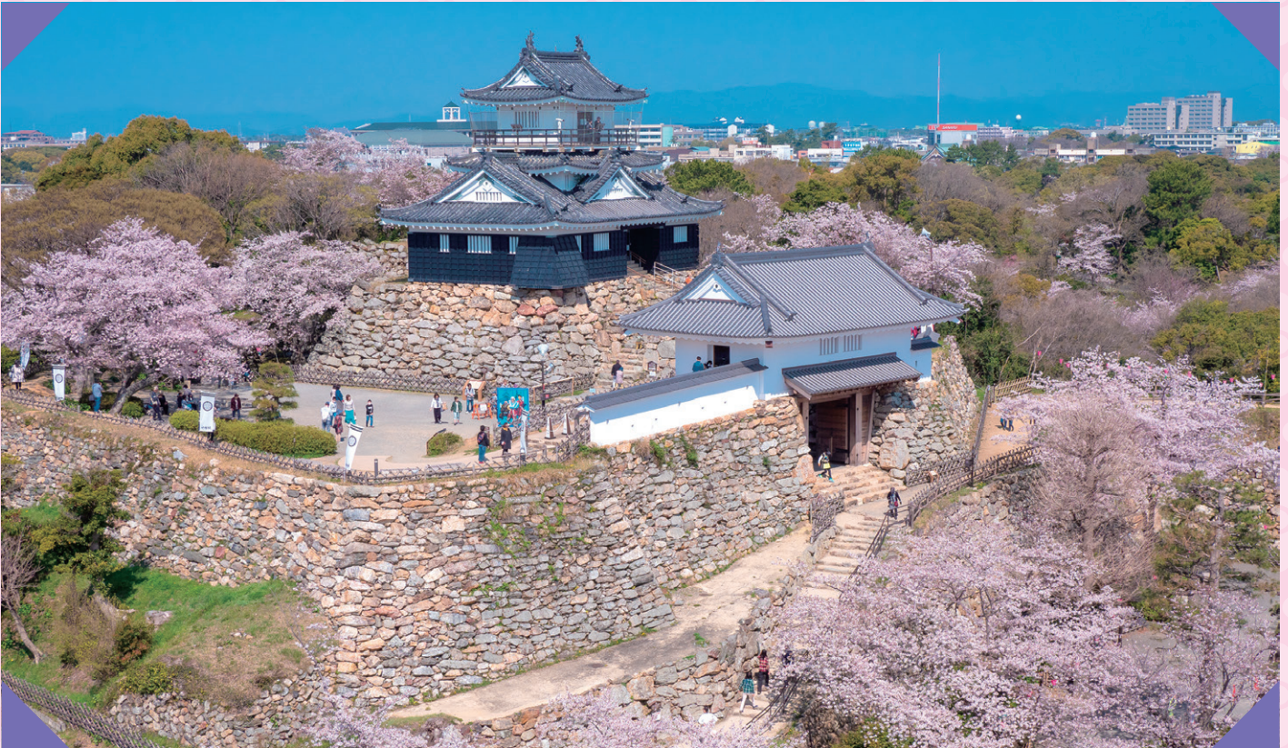
浜松城(浜松市中央区)